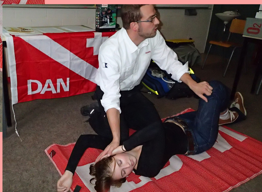
Position de latérale sécurité