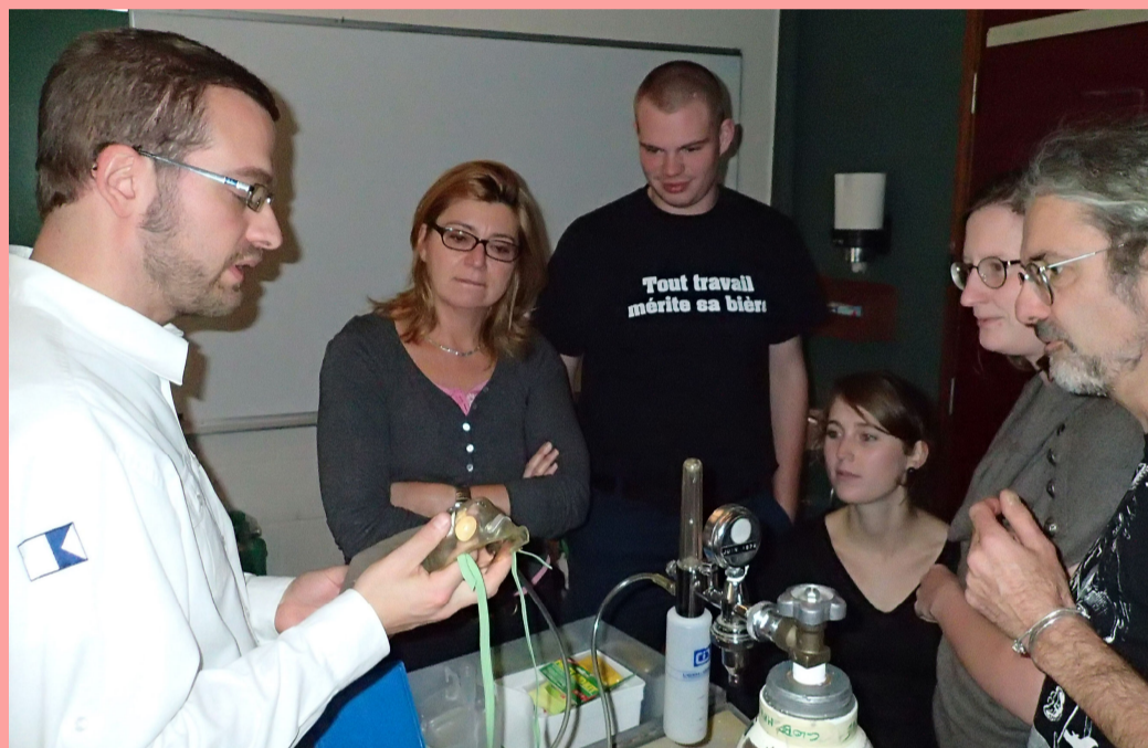
Mise en pratique