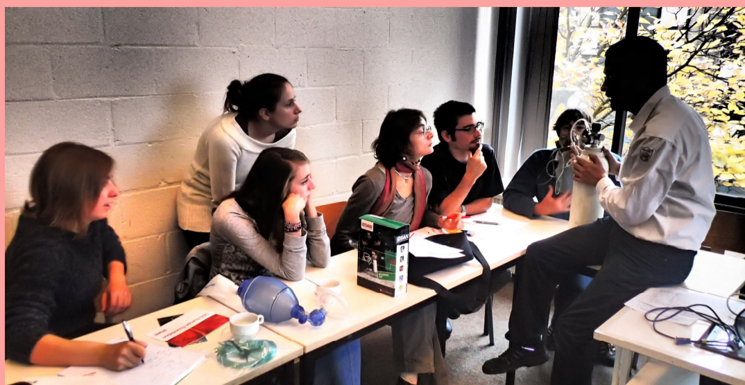
Sessions de cours théoriques